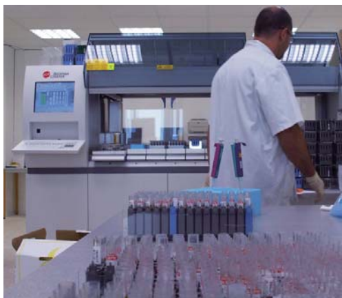
CBM Saint-Roch : la station robotisée de tri des échantillons

* hormis les activités PMA et de dépistage de HT21 par marqueurs sériques réalisées au Lamsi, site spécialisé en biologie de la reproduction.